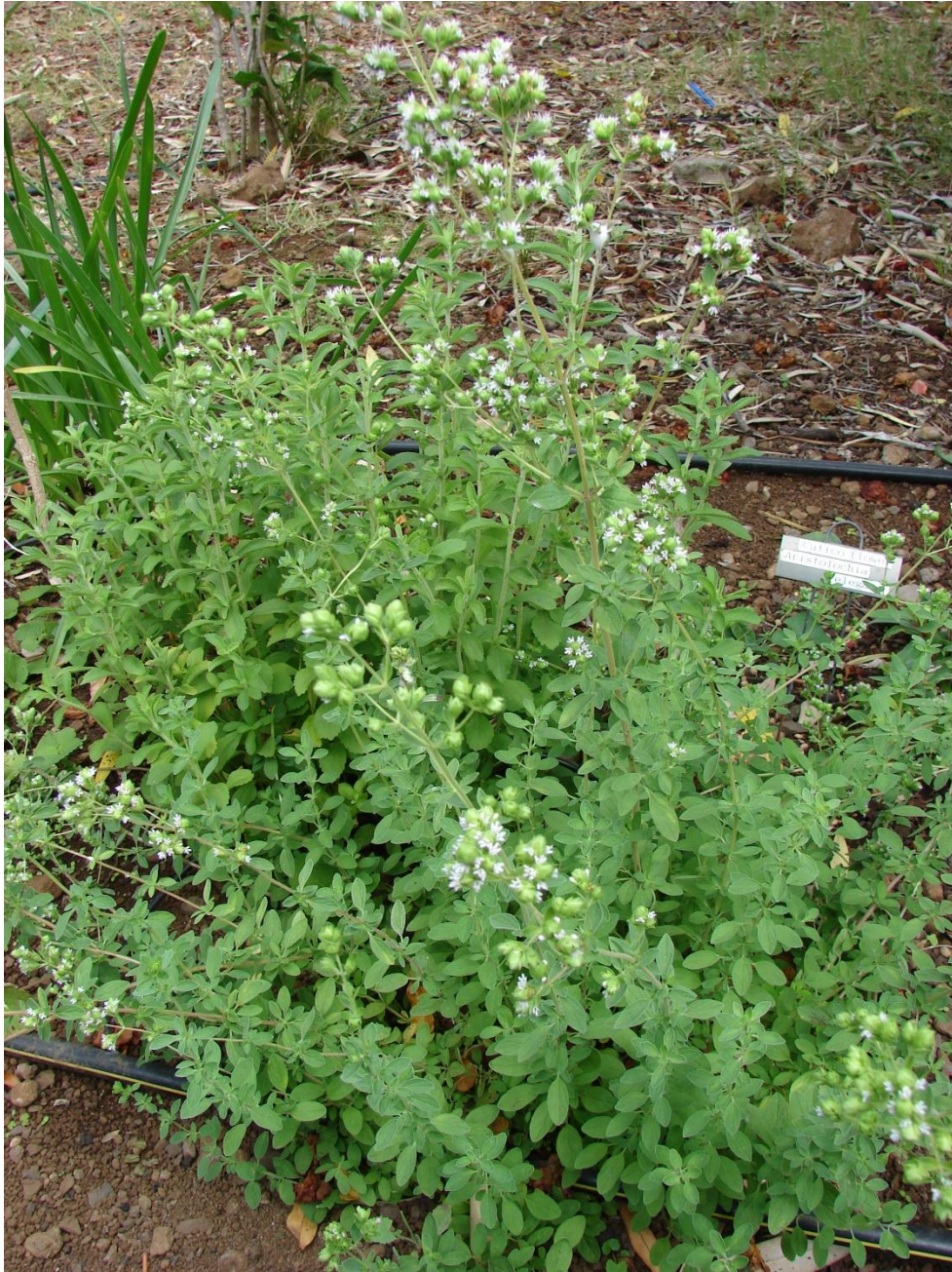
Origanum majorana - Majoran, Sweet Marjoram