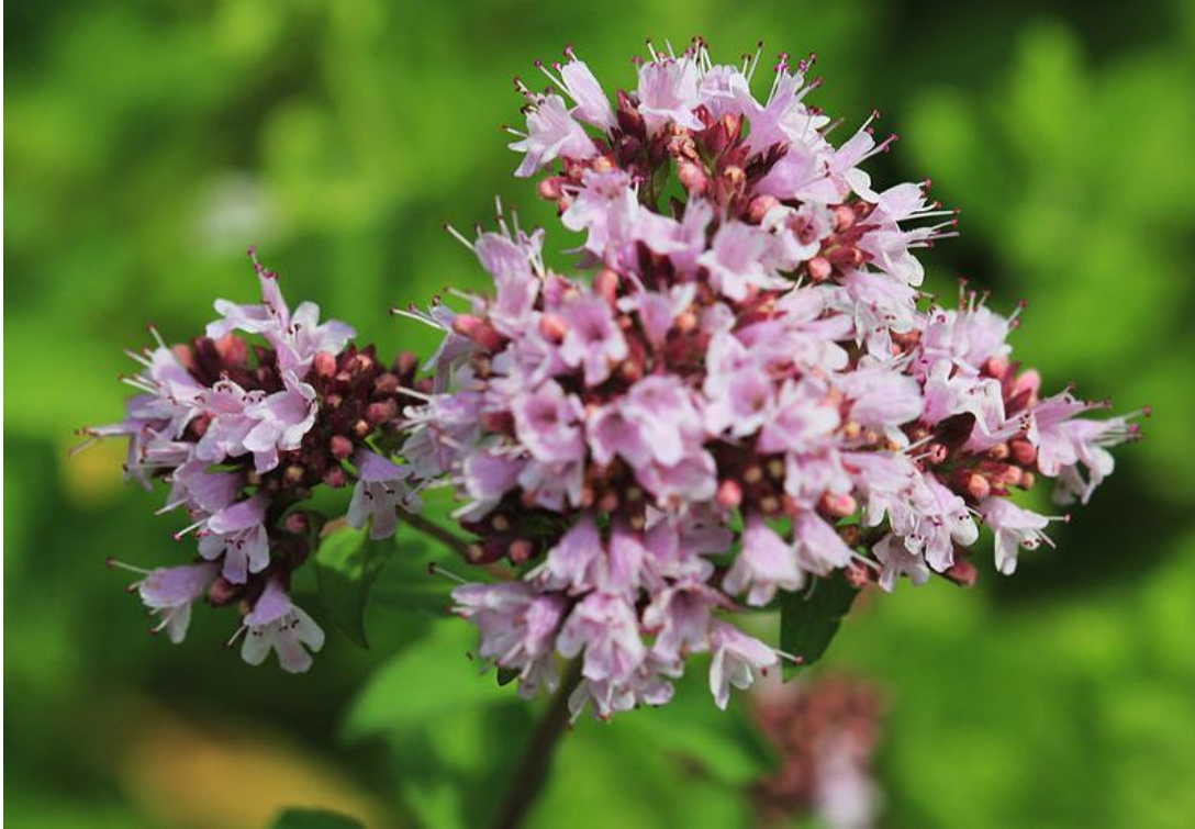
Origanum vulgare - Dost, Wild Marjoram