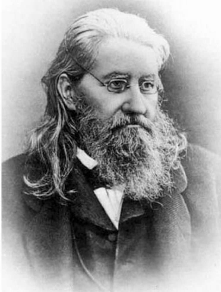
Constantin Hering (1800-1880)