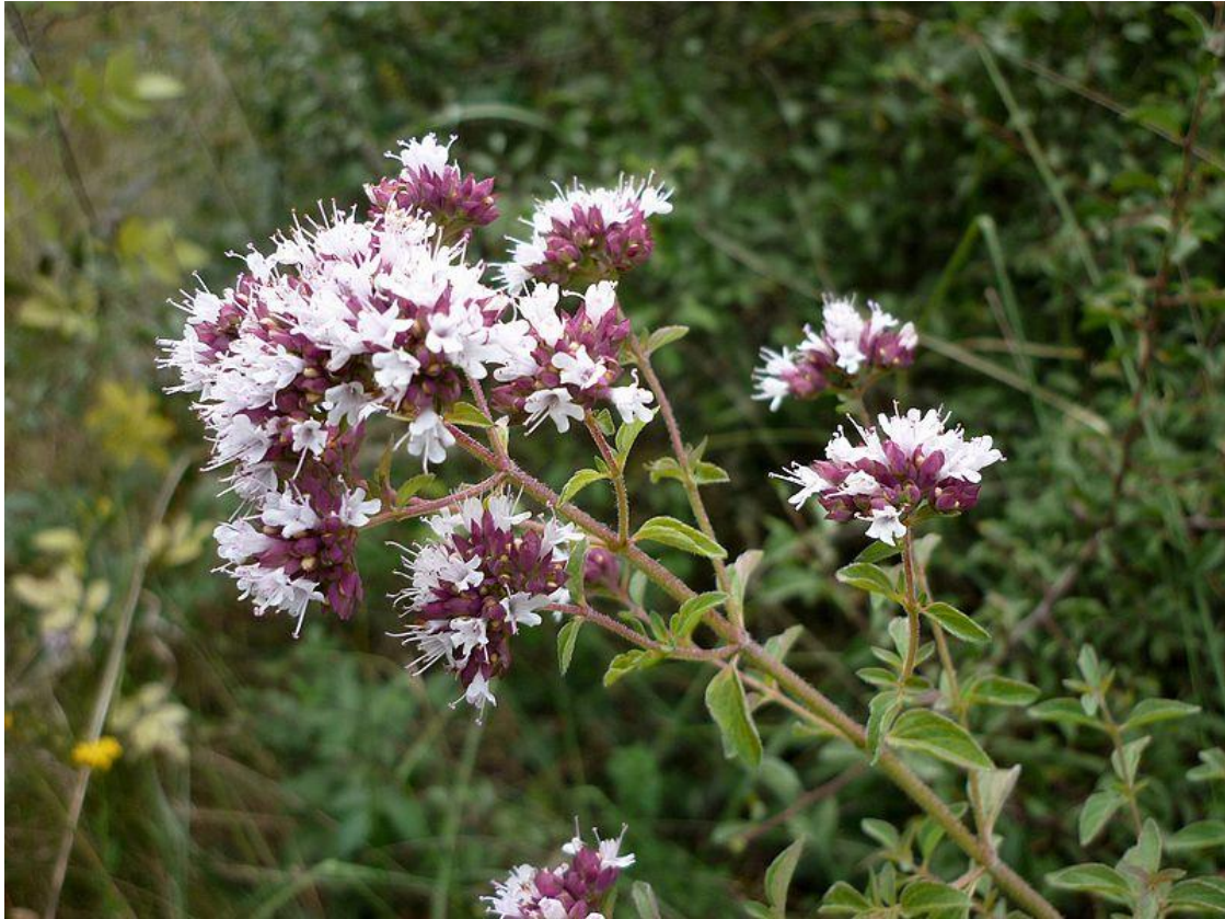
Origanum vulgare und majorana