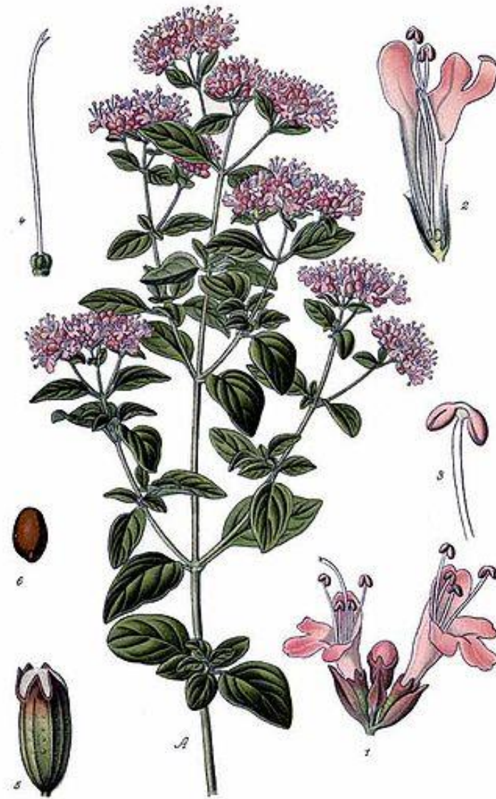
Pl. 254. Origan vulgáire . Origanum vulgare L.