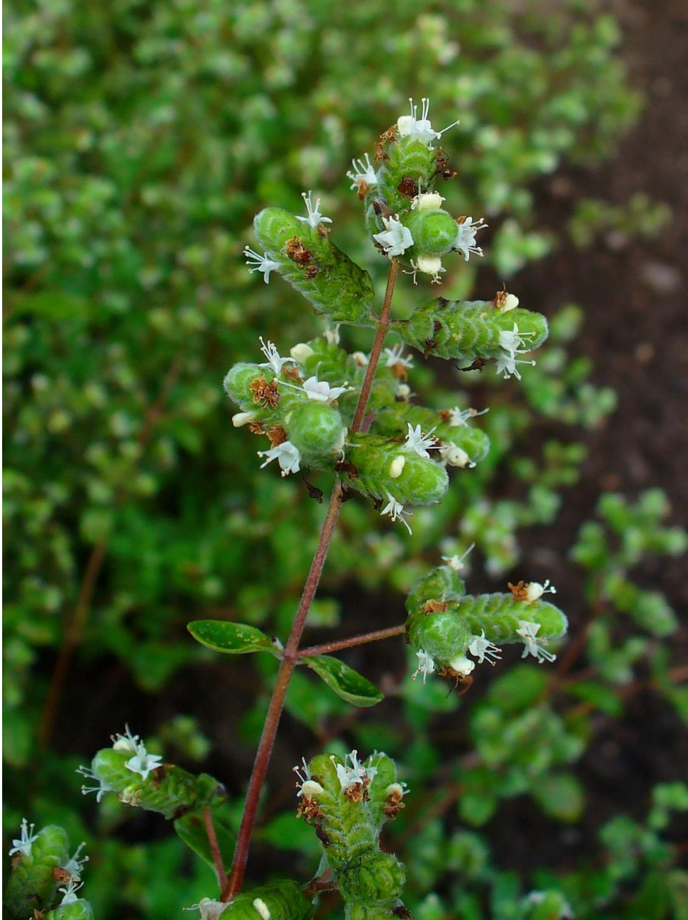
Origanum majorana - Majoran, Sweet Marjoram